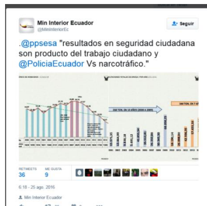
Publicación en el Twitter cuenta oficial del Ministerio del Interior